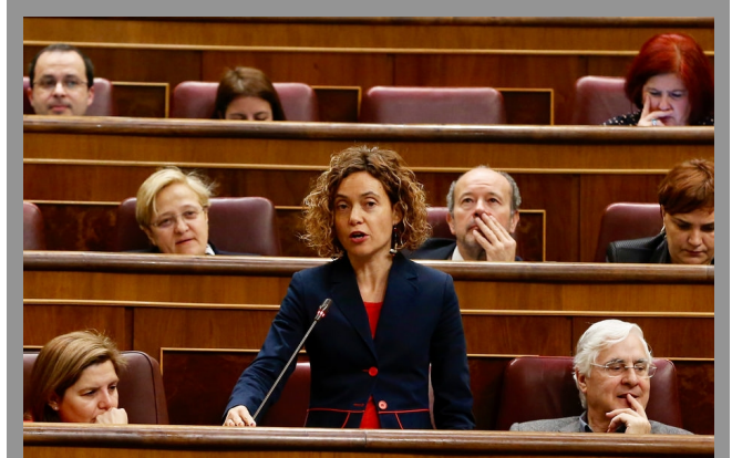
La diputada Meritxell Batet durante su intervención en la sesión de Control al Gobierno

La diputada del Grupo Socialista Meritxell Batet reclamó ayer al Gobierno que trabaje de verdad para la igualdad y ha acusado al Ejecutivo de Rajoy de llevar a cabo políticas que agudizan la desigualdad, y desprotegen a las personas más vulnerables. En este sentido, señaló que el informe de la Comisión Europea "alerta de los altos niveles de desigualdad, en exclusión social y en pobreza: España está a la cola de la UE". "Pero no se trata tanto de