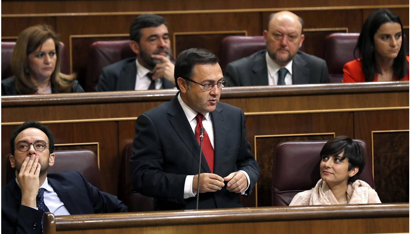
El diputado del PSOE, Miguel Ángel Heredia, durante su intervención en la sesión de Control al Gobierno

MADRID / El secretario general del Grupo Parlamentario Socialista Miguel Ángel Heredia ha explicado en la sesión de control al Gobierno en el Congreso de los Diputados la situación a la que se enfrentan los pensionistas de nuestro país desde que Rajoy impusiera la reforma de las pensiones en el año 2013. Heredia ha recordado que desde entonces los pensionistas han perdido poder adquisitivo: "Nuestros pensionistas son hoy un 20% más pobres que hace 5 años. Les han subido el IVA y el IBI. La luz subirá 100 euros este año. Tienen que pagar por sus medicamentos por primera vez y les han quitado más de 400 medicamentos de la seguridad social", ha denunciado, y ha alertado que la situación de quienes reciben la pensión mínima es aún más preocupante: "Los que tienen una pensión mínima, dos millones y medio, les ha ido peor. Este año su pensión les ha vuelto a subir poco más de un euro. ¿Le parece una subida decente?. Le recuerdo que los precios han subido un 3% en enero y otro 3% en febrero".