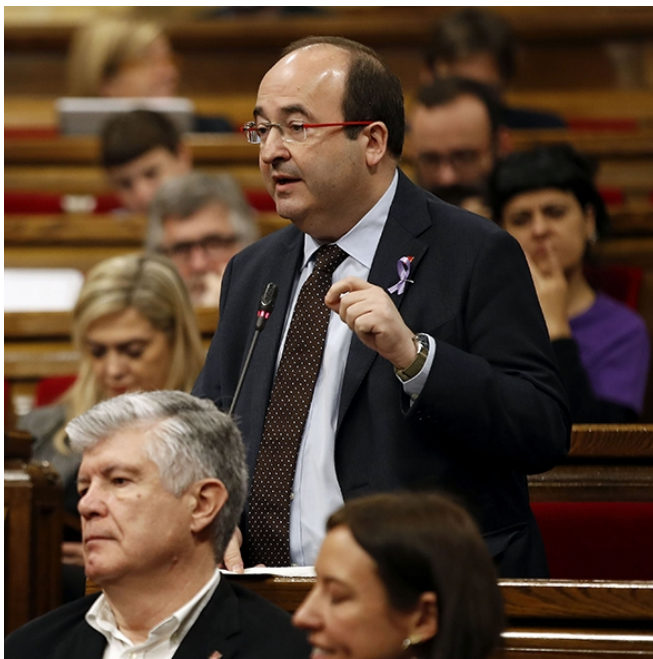
El líder del PSC, Miquel Iceta