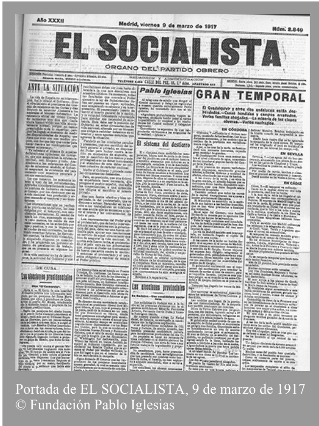
Portada de EL SOCIALISTA, 9 de marzo de 1917

La vida de España no se interrumpirá. Así lo ofreció el Gobierno. Hizo el ofrecimiento el presidente del Consejo de ministros en las Cortes y días después de anunciar Alemania a los neutrales el bloqueo submarino. La referencia oficial del último Consejo de ministros nos dice que "hasta ahora hemos vivido una vida absolutamente normal, porque no hemos prescindido ni de lo superfluo; pero que ha llegado el momento de medir las disponibilidades de España, que tiene que vivir con sus medios propios, con los que hay que contar para hacer frente a las contingencias que puedan..."