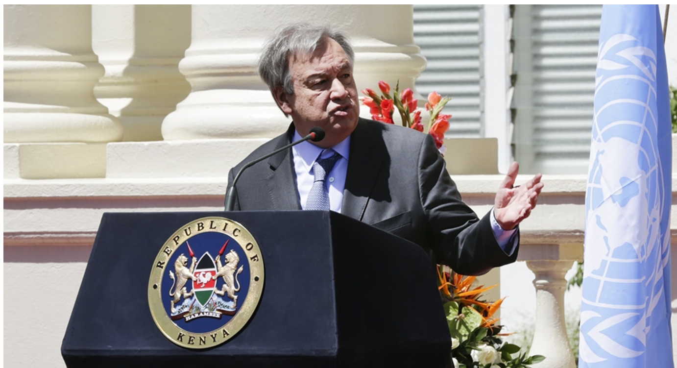
El secretario general de la ONU, el socialista António Guterres