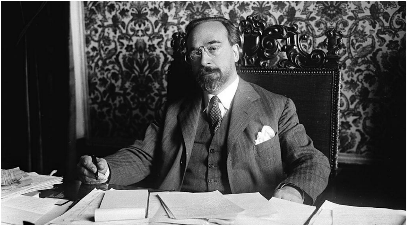
Año 1932.- Fernando de los Ríos en su despacho